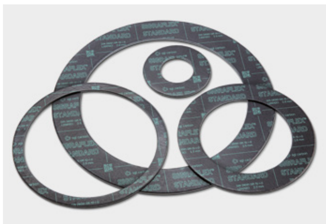
↑ Těsnění z SIGRAFLEX STANDARD