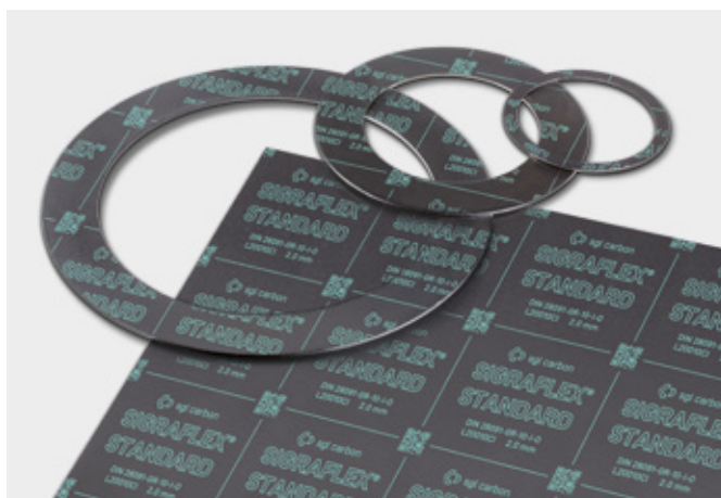
↑ SIGRAFLEX STANDARD Těsnící desky a těsnění